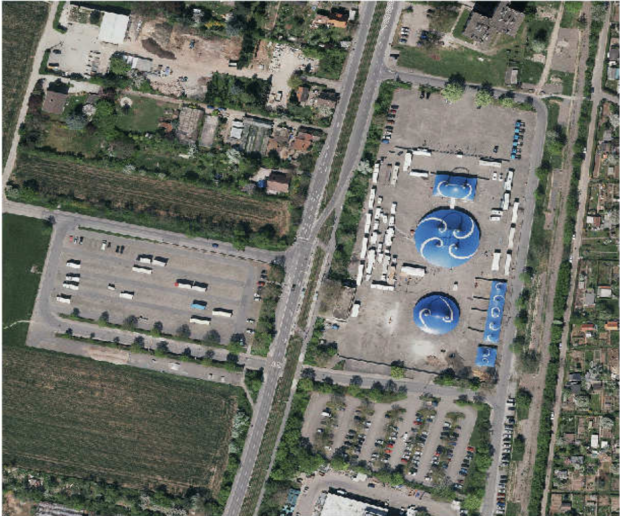
Bild 1: Heidelberg –Messplatz am Kirchheimer Weg mit angrenzenden Parkplätzen (für Pkw und LkW)

Größe des gesamten Areals: ca. 35.000 m 2